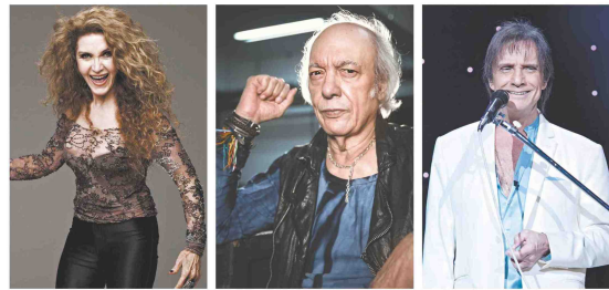
Roberto Carlos em uma apresentação ao vivo. À esquerda, Erasmo Carlos e Wanderléia em uma apresentação ao vivo. À direita, Erasmo Carlos em uma apresentação ao vivo.

Aniversariantes, Erasmo Carlos e Wanderléia viram "revistas e ampliadas" em projetos ANCINE anunciou que comprou os direitos de adaptação de dois livros de música brasileira para serem produzidos em formato de televisão. O projeto, que será lançado em 2016, trata-se de uma adaptação de dois livros de música brasileira: "Erasmo Carlos e Wanderléia" e "Roberto Carlos". Os livros, escritos por Gilberto Gil, foram publicados em 1970 e 1971, respectivamente. Eles contam a história dos dois músicos e sua influência na música brasileira. O projeto será produzido pela Ancine e terá como apresentador o ator e músico Roberto Carlos. Roberto Carlos tem a honra de ser o primeiro apresentador da série. Ele já fez parte de outros projetos de televisão, como "O Grande Show do Roberto Carlos" e "Roberto Carlos em Concerto". Os livros de Gilberto Gil são considerados obras-primas da literatura brasileira. Eles foram escritos em um momento de grande efervescência cultural no Brasil. Os livros foram publicados em uma época em que a música brasileira estava em um momento de grande renovação. Os livros de Gilberto Gil são considerados obras-primas da literatura brasileira. Eles foram escritos em um momento de grande efervescência cultural no Brasil. Os livros foram publicados em uma época em que a música brasileira estava em um momento de grande renovação.