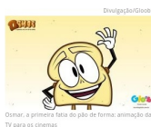
Osmar, a primeira fatia do pão de forma: animação de TV para os cinemas